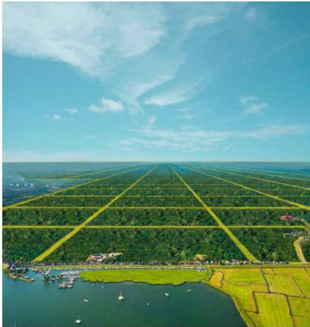
Studio Hartzema & FRESH, Project Holland, Herbebossing bij Durgerda

De corona-crisis is voor Hartzema onverwacht gekomen. Op de vraag over de werkelijkheid na deze crisis reageert hij ongemakkelijk. Hij vindt die vraag veel te vroeg komen, nu de orkaan nog maar een bries is. Ook vindt hij dat er anders dan bij de vorige crisis, geen aanwijsbare schuldige is en dat we het zelf zijn. Daarmee is deze crisis fundamenteleler.