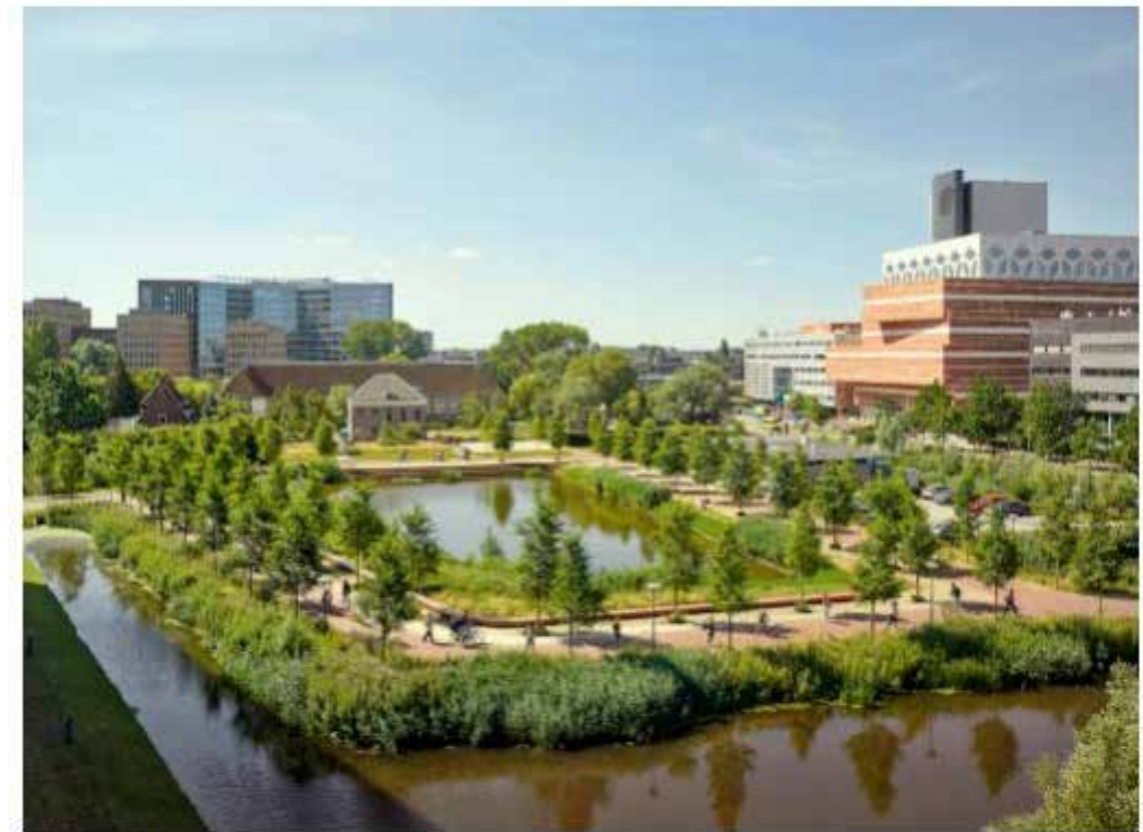
Studio Hartzema, Schilperoort memorial, Leiden BioScience Park