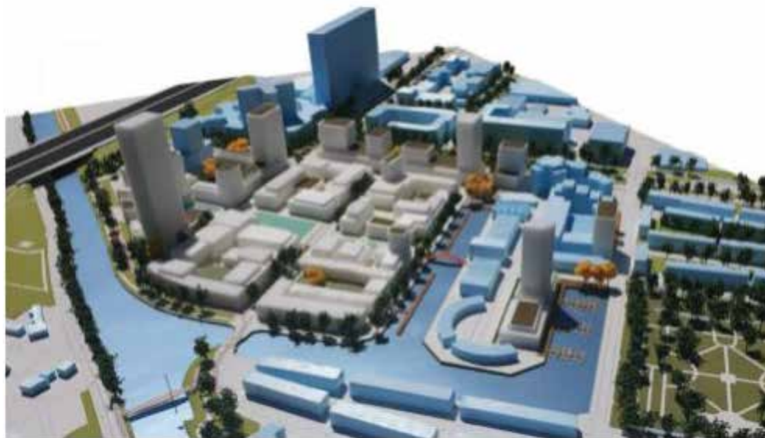
Studio Hartzema, Havenkwartier Plaspoelpolder Rijswijk, Stedenbouwkundig Kader